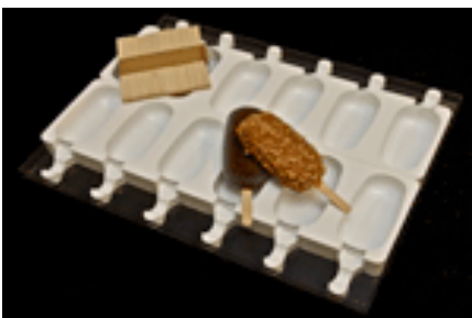
PRODUITS D'UTILISATION Page: 3