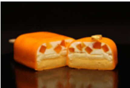
«LES 6 EXKIMOS» SUR BASE 50 Page: 3