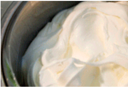
«IL GELATO» AGRIMONTANA Page: 2