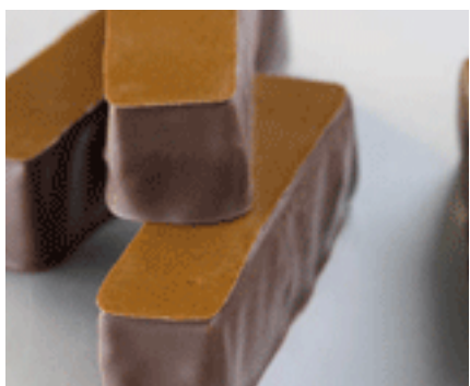
COUVERTURES D'ENROBAGE PAGE: 3