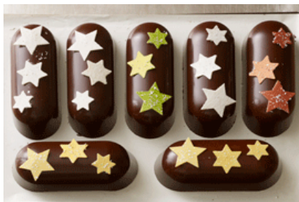
LA BÛCHE 2011 PAGE: 2