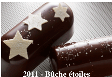
2011 - Bûche étoiles

LA COIFFE OFFRE AUX CONSOMMATEURS UNE TOUCHE D'ORIGINALITÉ PAR SON «COTÉ SURPRISE». ELLE DÉVOILE LE CONTENU DU DESSERT UNE FOIS SUR LA TABLE.