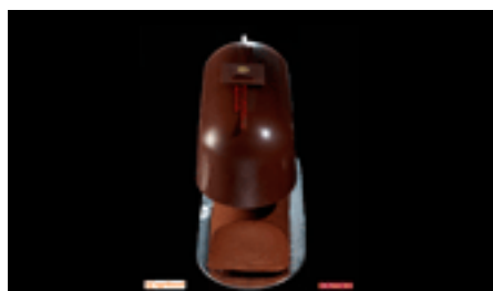
2010 - Bûche surprise marrons

LA COQUE CHOCOLAT QUI VIENT COIFFER LA BÛCHE EST PARSEMÉE D'ÉTOILES QUI NOUS RENVOIE AUX FÊTES DE NOËL.