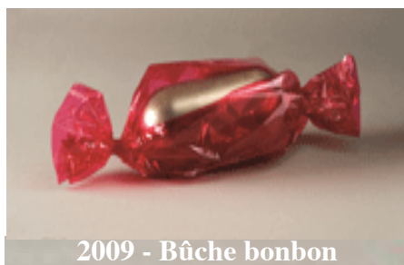
2009 - Bûche bonbon

L'ENTREMETS 2011 POURRA ÊTRE RÉALISÉ SOUS FORME DE BÛCHE (CF PHOTO, RECETTE DISPONIBLE).